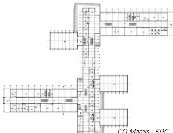
CO Marais - RDC